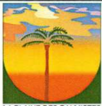
LA PLAINE DES PALMISTES